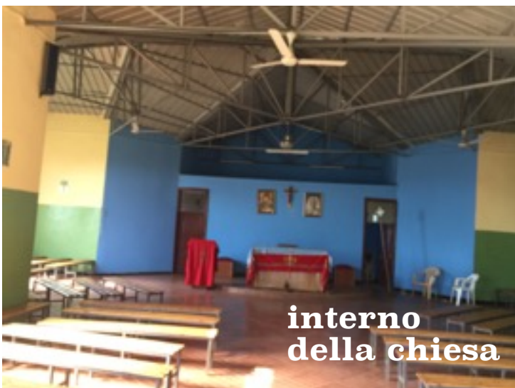
interno della chiesa