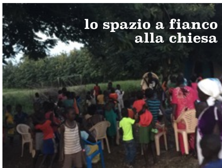
lo spazio a fianco alla chiesa