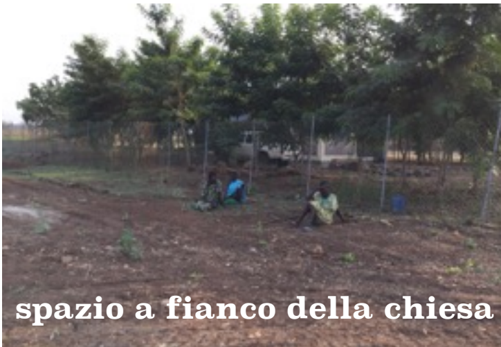
spazio a fianco della chiesa