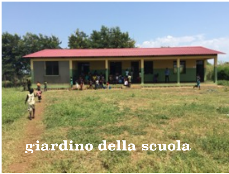
giardino della scuola