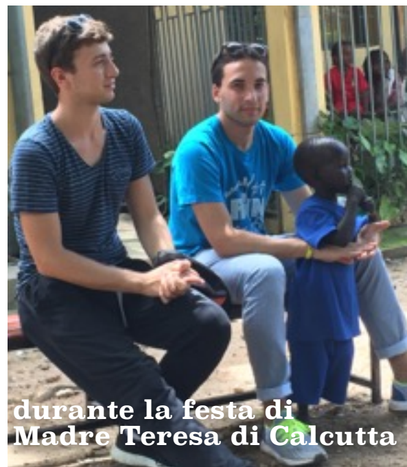
durante la festa di Madre Teresa di Calcutta