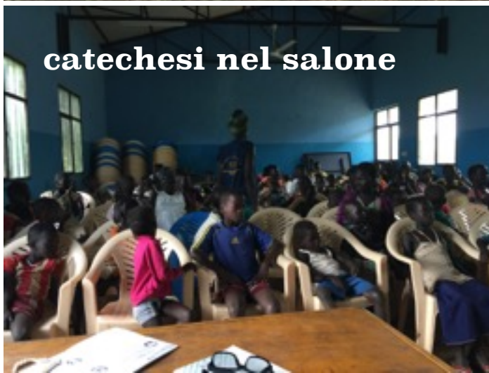
catechesi nel salone