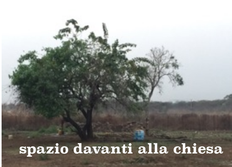
spazio davanti alla chiesa