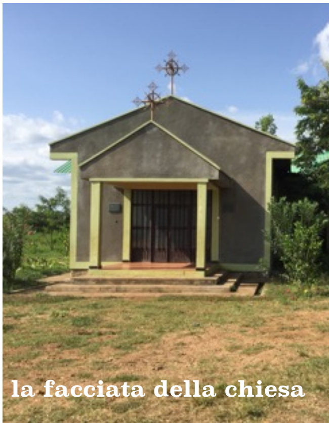
la facciata della chiesa