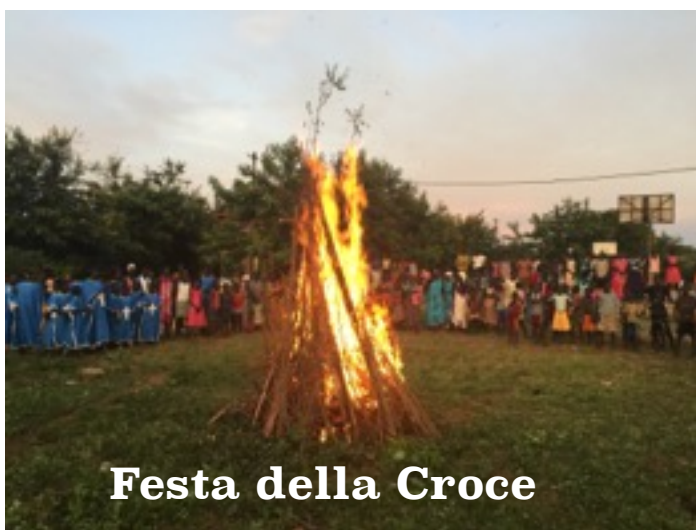
Festa della Croce