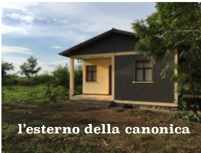
l'esterno della canonica