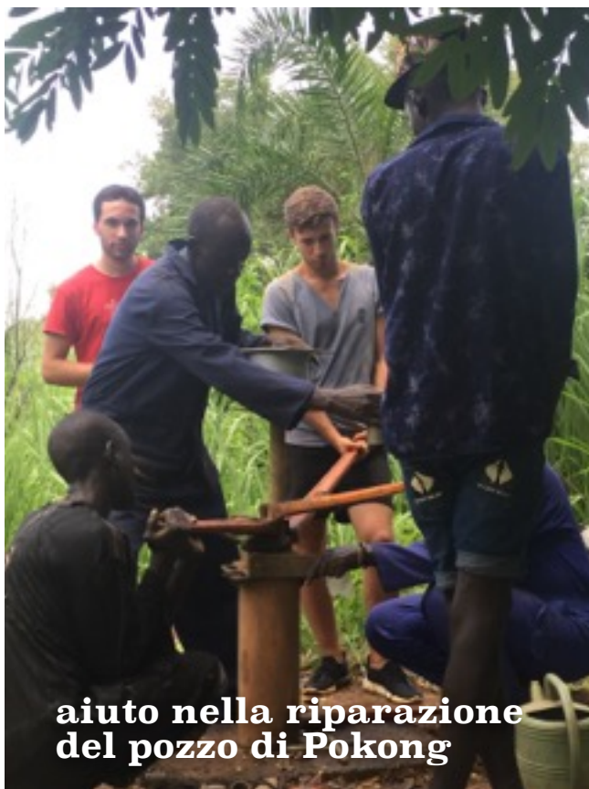
aiuto nella riparazione del pozzo di Pokong

le missionarie della carità di Gambella, fedeli sorelle di Santa Madre Teresa di Calcutta, patrona della comunità di Abol, la cui solennità abbiamo festeggiato durante la nostra permanenza;