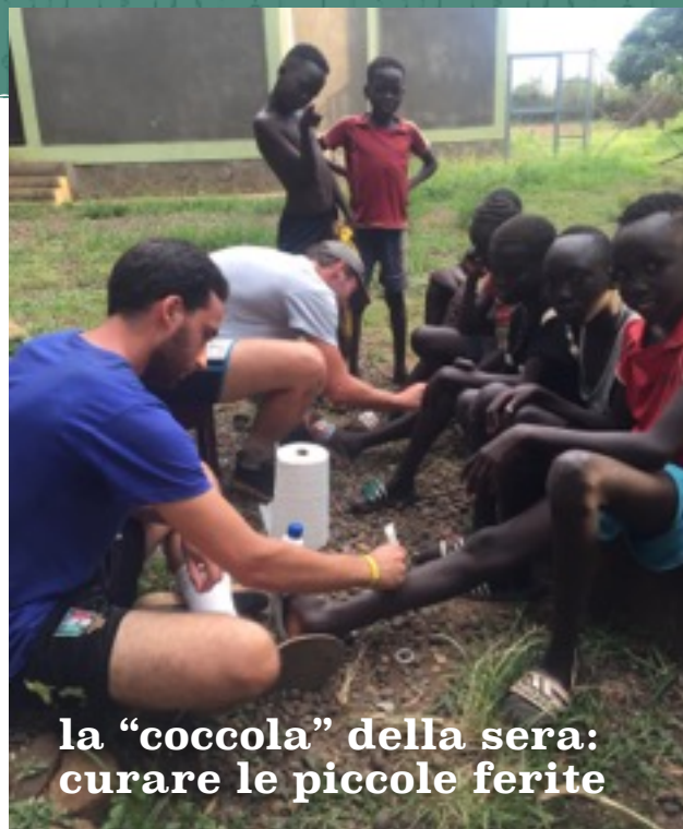
la "coccola" della sera: curare le piccole ferite

il popolo Komo, cacciatori di Pockong: villaggio raggiungibile solo a piedi e difficilmente con le abbondanti piogge stagionali. Pockong è "la vera Africa", un mondo talmente distante dalla nostra quotidianità che ci pone in seria discussione su cosa sia davvero l'essenziale nella vita. Un villaggio che potremmo definire "da documentario", ma che nella sua realtà possiede tratti unici e caratterizzanti che dimostrano come la vita sia la ricchezza unica che porta alla felicità.