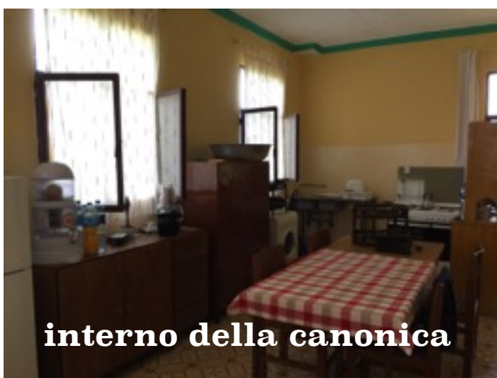
interno della canonica