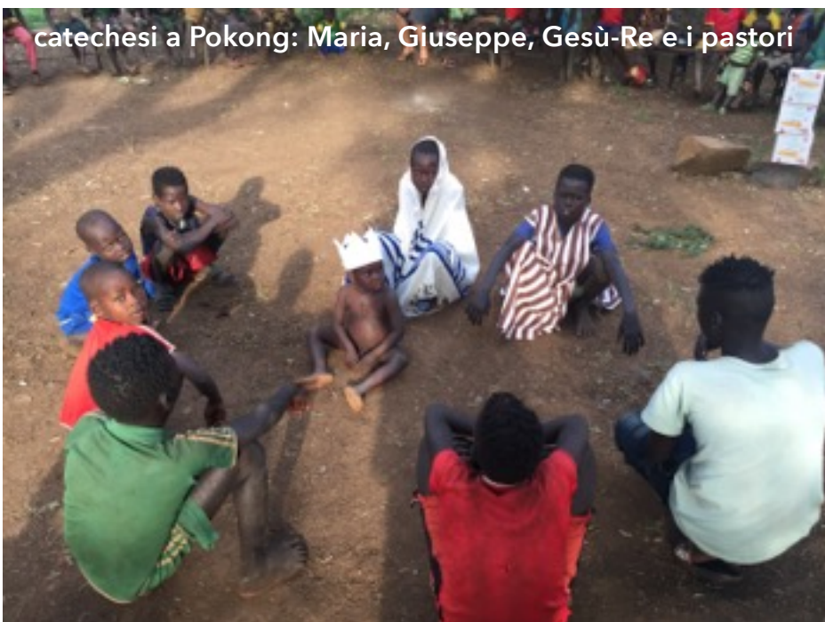
catechesi a Pokong: Maria, Giuseppe, Gesù-Re e i pastori

Così procediamo nel nostro cammino, dovendo adesso rafforzare la pianticella che è nata e che necessita di cura, di costanza, di consolidamento. Ma non dobbiamo dimenticare la parola di San Paolo che dice: "Né chi pianta, né chi irriga è qualche cosa, ma Dio che fa crescere" (1 Cor 3,7).