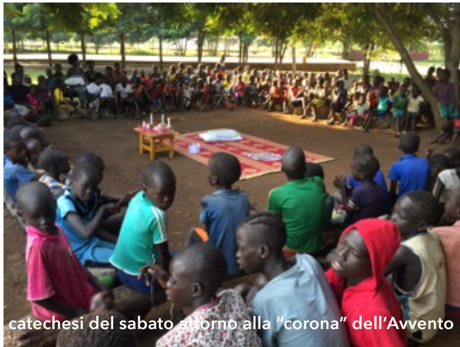
catechesi del sabato attorno alla "corona" dell'Avvento